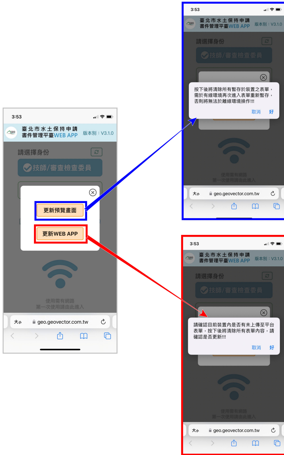
圖 3：點選「更新與覽畫面」與「更新 WEB APP」按鈕

按下按鈕前，請務必確認使用裝置是否有暫存表單或有未送至平臺案件 ，若已確認無未送出資料，請按下「更新預覽畫面」及「更新 WEB APP」兩顆按鈕，即更新成功。