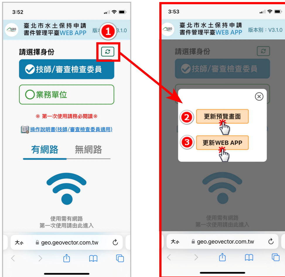
圖 2：「更新預覽畫面」與「更新 WEB APP」於首頁右上方

清除完裝置快取後，請重新進入書件管理平臺 WEB APP，請點選右上方更新圖示，點下後畫面出現「更新預覽畫面」及「更新 WEB APP」兩顆按鈕。