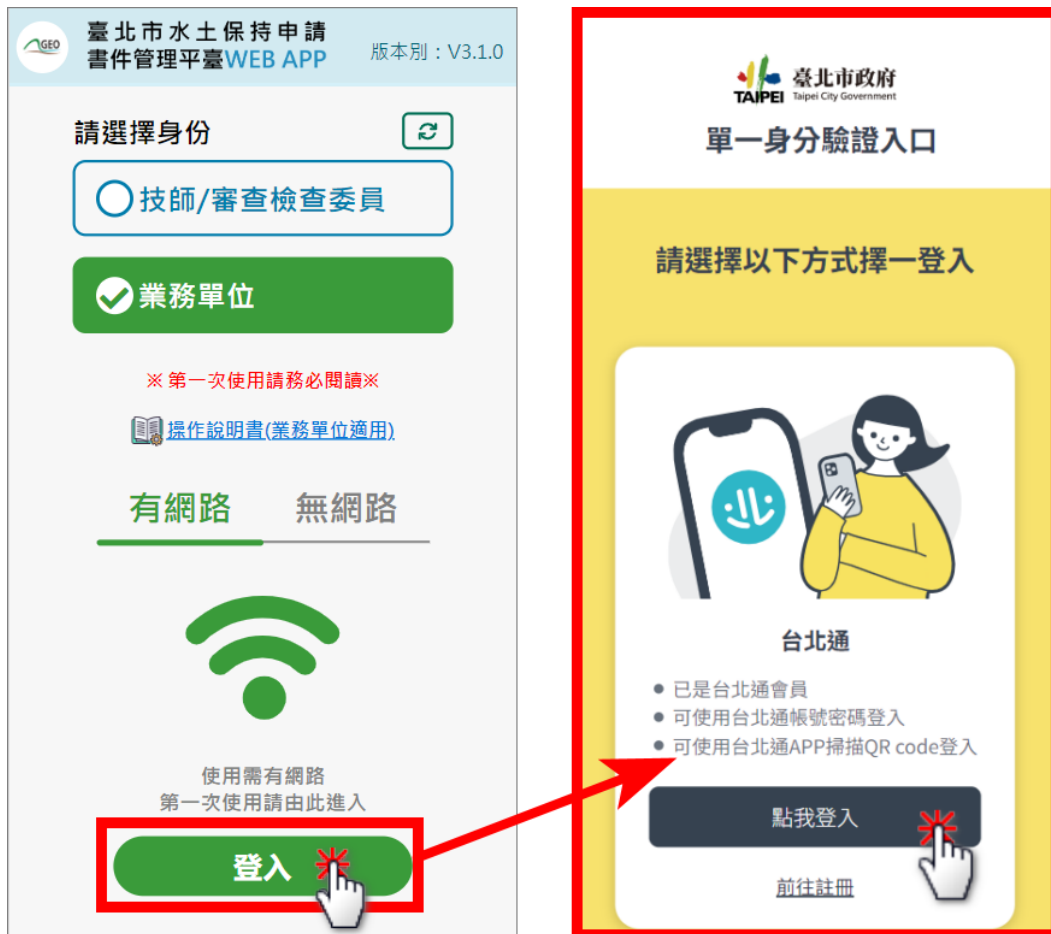
圖 6：行動裝置書件平台登入畫面

點選「登入」後，系統即會導向「台北市政府單一身分驗證入口」，使用者即可使用台北通或行動自然人憑證方式進行登入。