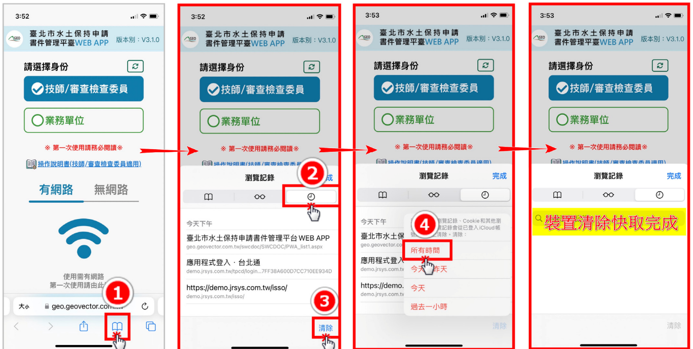
圖 1：清除裝置快取（以 iPhone 手機 Safari 為示範）