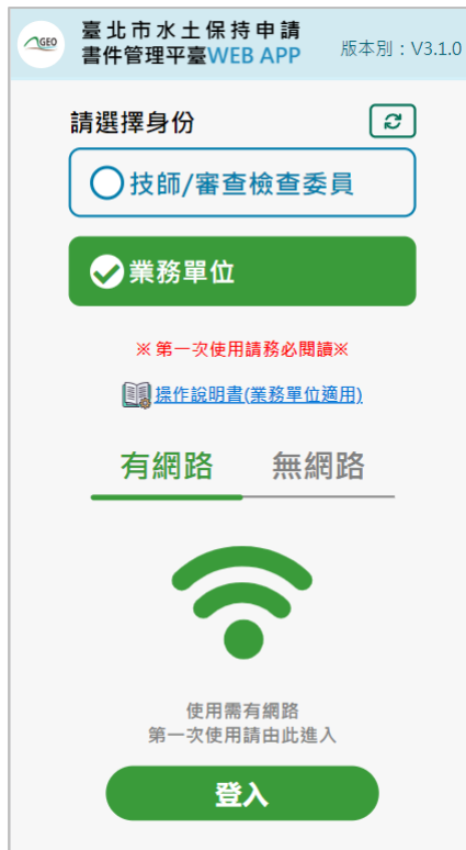
圖 5：行動裝置書件平台首次使用登入畫面

使用行動裝置書件平台首次登入時，須於有網路之環境進行操作，選擇操作身分後點選下方登入按鈕。