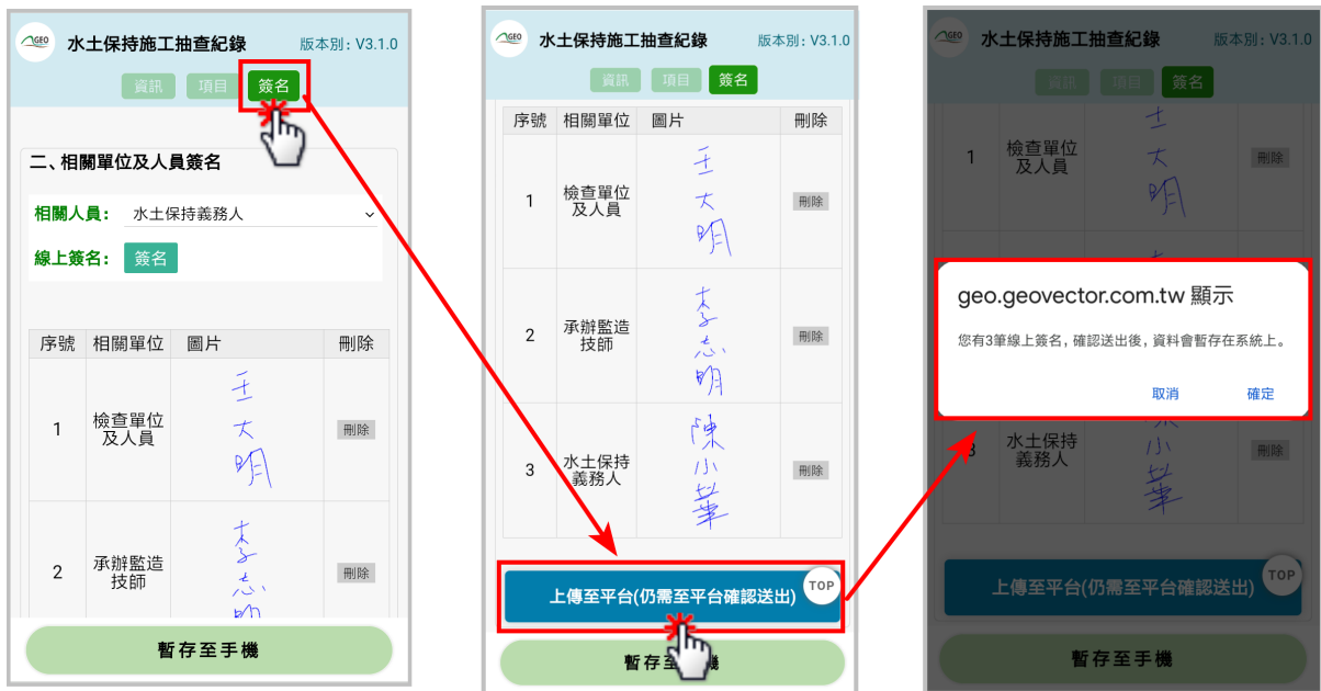
圖 19：檢查表單上傳至平台

若欲將填登完畢之檢查表單上傳至平台，請務必確認您在有網路的環境下操作。表單填寫完畢欲上傳至平台時，點選至各表單最後一個頁籤後，往下至網頁底部點選「上傳至平台(仍需至平台確認送出)」，系統將提醒目前共有幾筆簽名，於確認無誤後，表單即上傳至「臺北市水土保持申請書件管理平台」。