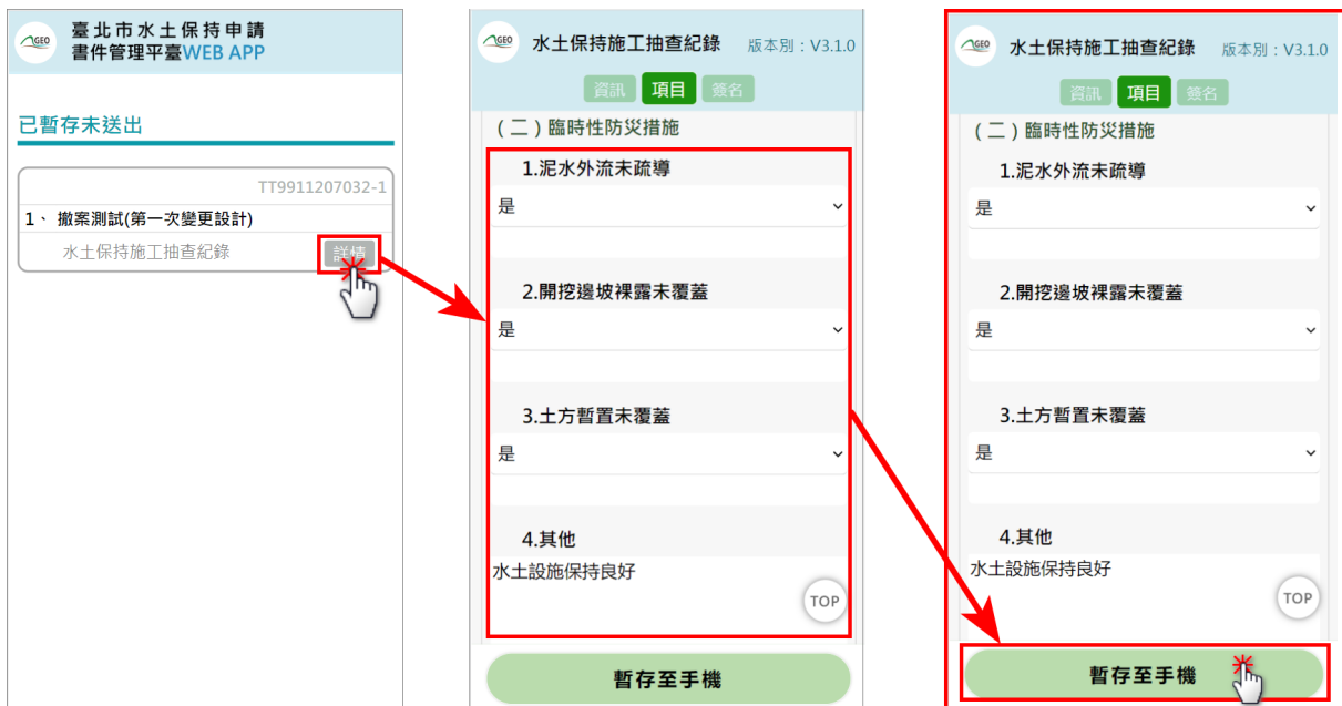
圖 18：離線暫存表單編輯

使用者可進行暫存表單編輯，點選詳情進入表單後，系統將自動載入暫存之表單內容，即可進行編輯。編輯完畢後即可點選「暫存至手機」，進行該次檢查表單填登存檔。